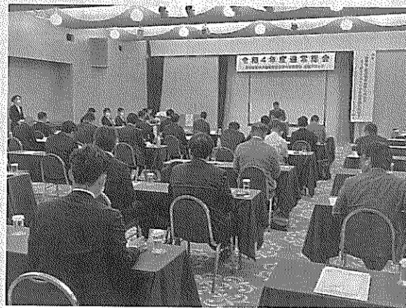
久々の集合型総会の開催となった

「コロナ禍でウェブを駆使して活動してきたが、そのリアルな活動も行うという方向性になってきた。今後は両方を生かした活動を行っていくことになるだろう。ブロック長になれば全国の活動に参加する機会も多くなると思うが、なかなかウェブだけが、なかなかウェブだけが」